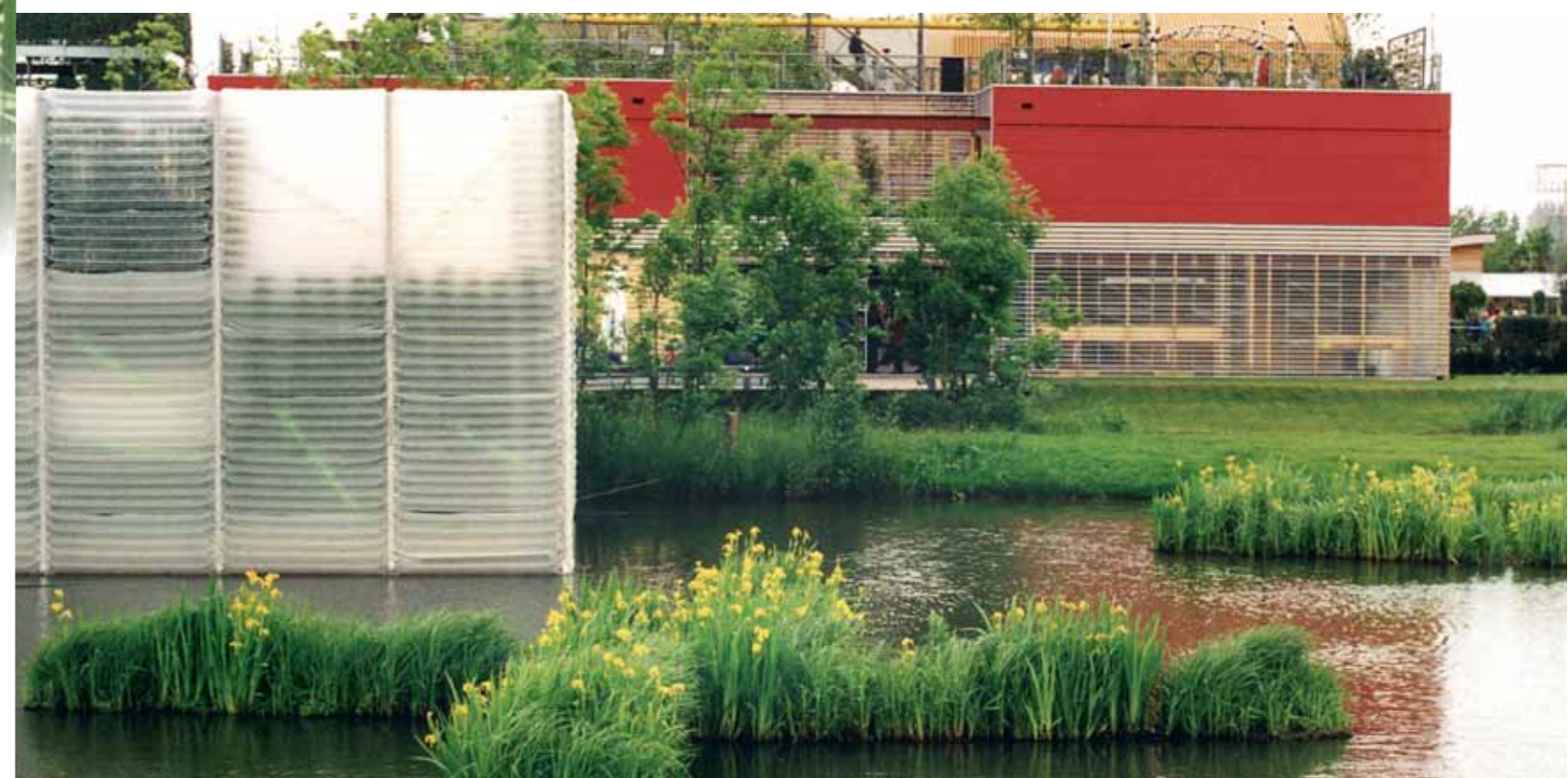
↑ En quelques jours le radeau flottant fleurit

Pour en savoir plus : www.aquaterra-solutions.fr